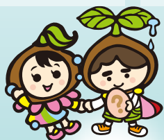
ファスマック花子 ファスマック太郎

Instagram @fasmac_official X (旧Twitter) @fasmac_taro Facebook @fasmacjp