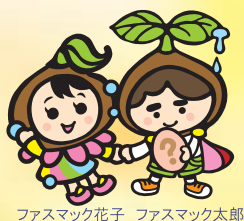
ファスマック花子 ファスマック太郎

販売元 株式会社 グライナー・ジャパン TEL:03-5843-9159 E-mail:oligosupport.jp@gbo.com