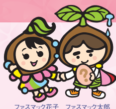
ファスマック花子 ファスマック太郎

販売元 株式会社 グライナー・ジャパン TEL:03-5843-9159 E-mail:oligosupport.jp@gbo.com