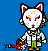
ファスマック公式マスコット カクさん