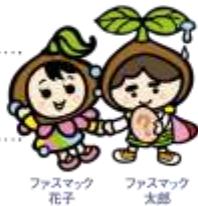
ファスマック 花子 ファスマック 太郎